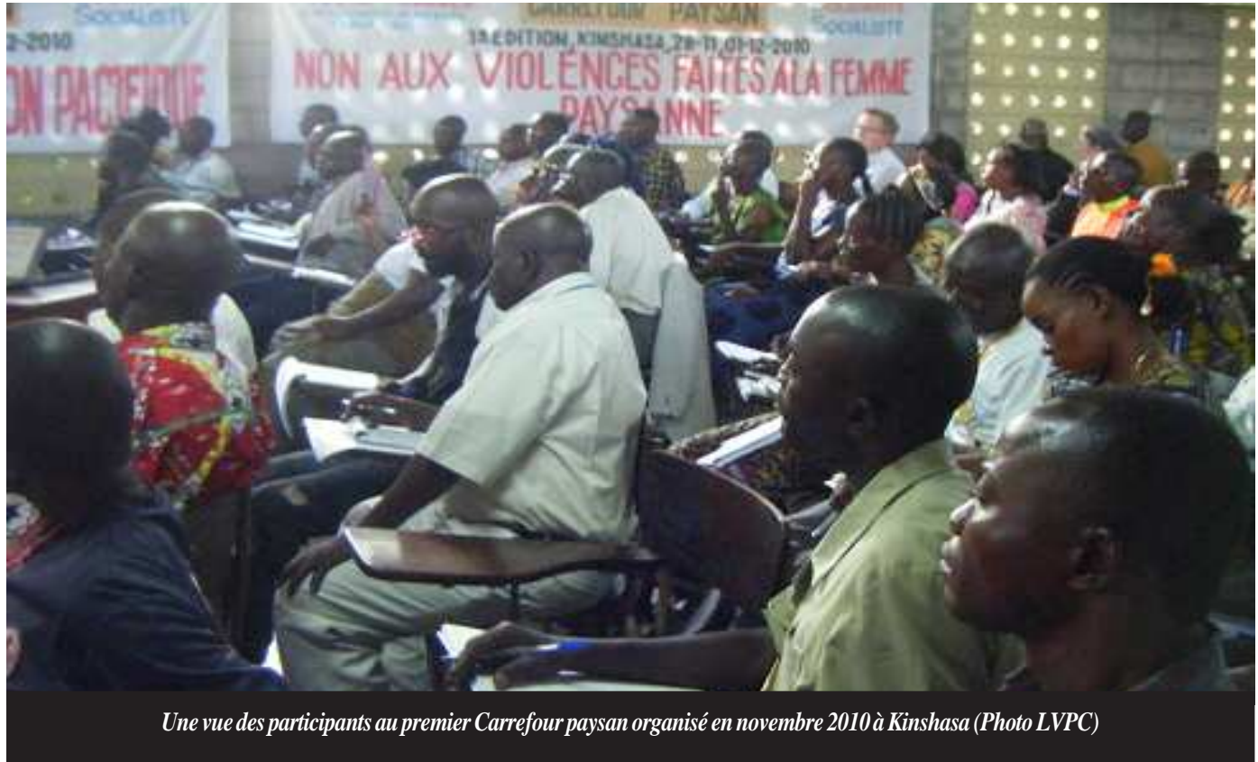
Une vue des participants au premier Carrefour paysan organisé en novembre 2010 à Kinshasa