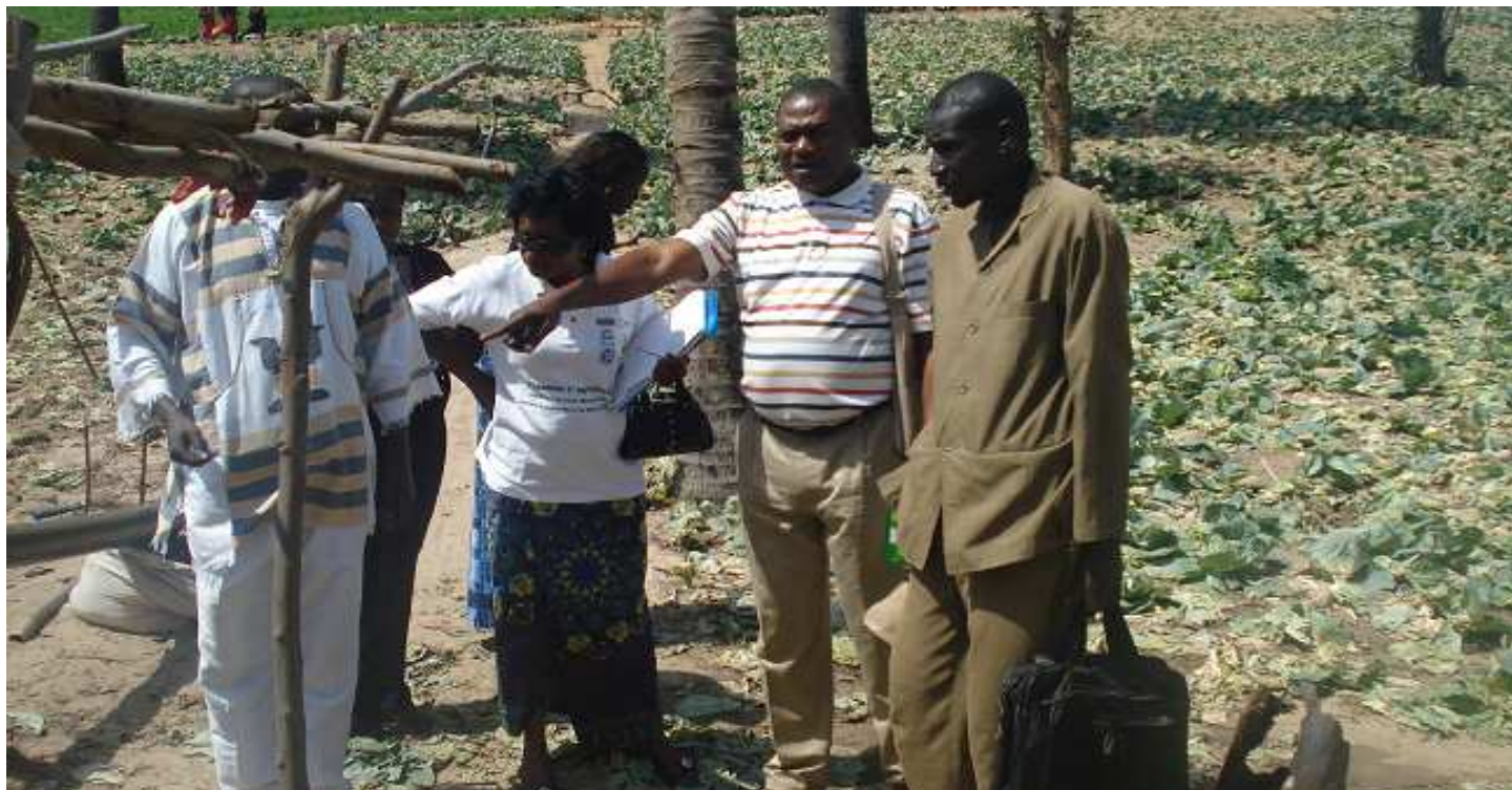
NPM: La délégation congolaise lors de leur visite à la FONGS (Sénégal)

Le Projet d'Appui à la Réhabilitation du Secteur Agricole et Rural (PARSAR), a organisé une visite d'échanges des Fâtières des Organisations Paysannes du Bas-Congo et de Bandundu au Sénégal en vue de faciliter la pérennisation et le développement des acquis du projet. Cette visite a été effectuée auprès de la Fédération des organisations non gouvernementales du Sénégal (FONGS Action Paysanne) et de ses membres. Quatre associations membres de la FONGS ont été visitées dont les centres d'intérêts ont été : La structuration et le fonctionnement des organisations de producteurs ; Les activités menées par l'association et les principaux résultats obtenus notamment en faveur des familles ; Le financement des activités et le partenariat ; Les logiques filières : tomate industrielle, riz, oignon, élevage ; Les difficultés rencontrées dans la mise en œuvre des activités.