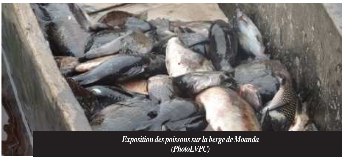
Exposition des poissons sur la berge de Moanda

Ainsi, l'un des représentants des associations des pêcheurs de Pool Malebo ayant pris la parole, avait déclaré à cette occasion que la réglementation de ce secteur s'avère imminente étant donné que leurs associations comptent à ce jour, plus de dix mille personnes. « Depuis plus de trente ans, il n'y a jamais eu une réglementation de la pêche... Le poisson est une denrée périssable. Le gouvernement doit prendre des mesures de protection de ce potentiel, parce qu'aujourd'hui, il y a baisse du niveau de capture qui a l'incidence sur le revenu du pêcheur », avait-il déclaré.