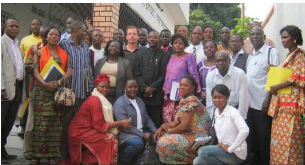
Photo de famille des participants à l'atelier organisé par la COPACO