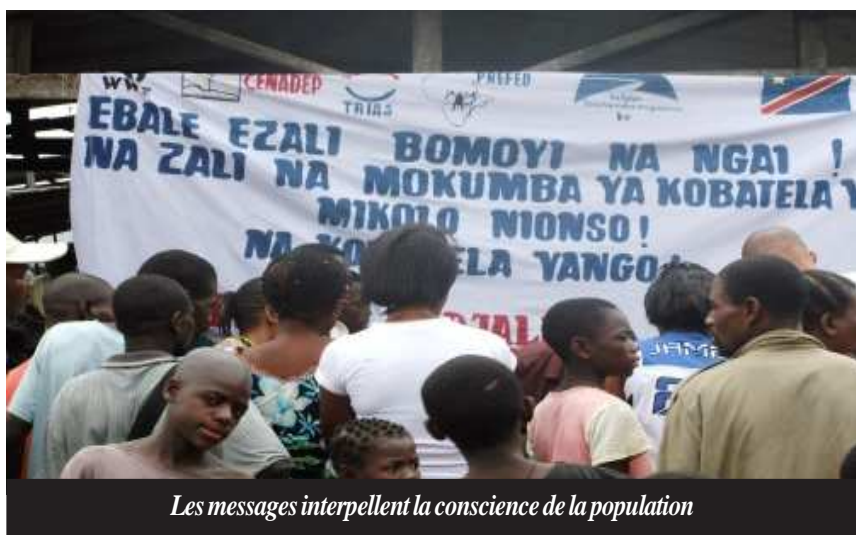
Les messages interpellent la conscience de la population

produits de la pêche a été repartis en 3 parts dont 30% aux associations qui ont donné les filets, 30% aux pêcheurs mobilisés pour la cause et les 40% devaient être versés dans une caisse pour le fonctionnement de l'inter-fédération, une manière également de préparer les associations à l'auto prise en charge post-projet.