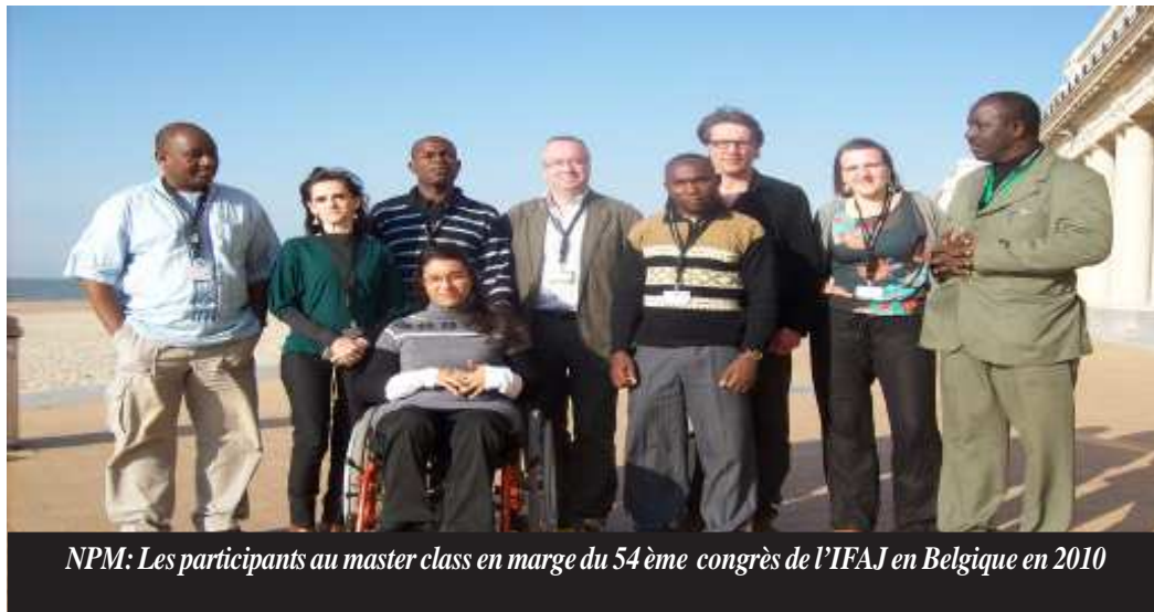
NPM: Les participants au master class en marge du 54 ème congrès de l'IFAJ en Belgique en 2010

D u 14 au 18 septembre 2011, les journalistes agricoles du monde entier vont se retrouver au Canada pour participer au 55 ème Congrès de la Fédération Internationale des Journalistes Agricoles, IFAJ, édition 2011. Les travaux de ce Congrès vont se dérouler respectivement dans les villes de Guelph et de Niagara Falls. Placé sous le thème : « Nouvelles expériences mondiales pour l'agriculture », les délégués auront l'opportunité d'explorer beaucoup de techniques nouvelles en vogue sur les activités d'élevage de gros bétail, l'horticulture, la production du vin et autres secteurs de l'agriculture canadienne. En outre, ils auront l'occasion d'apprendre comment les canadiens ont révolutionné