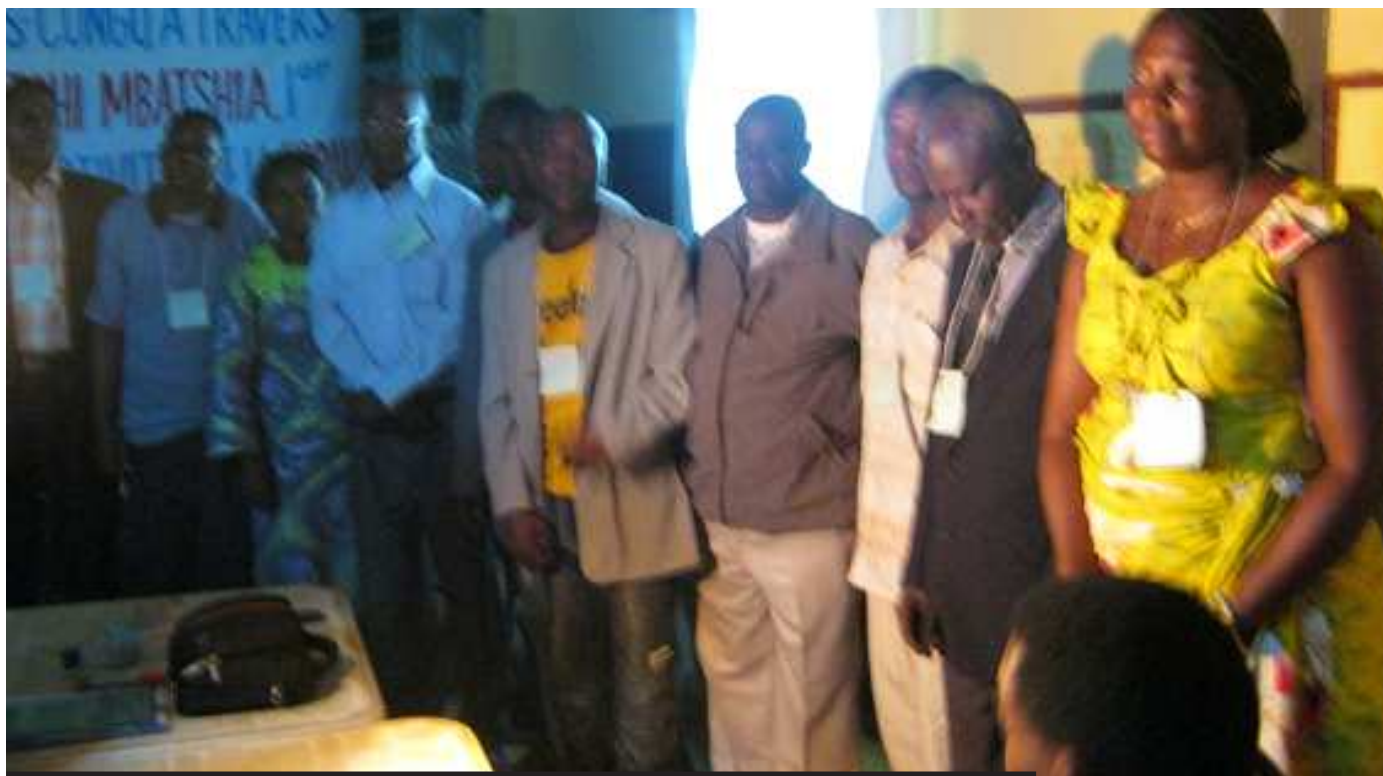
Le nouveau Comité fédéral de la FOPAKO