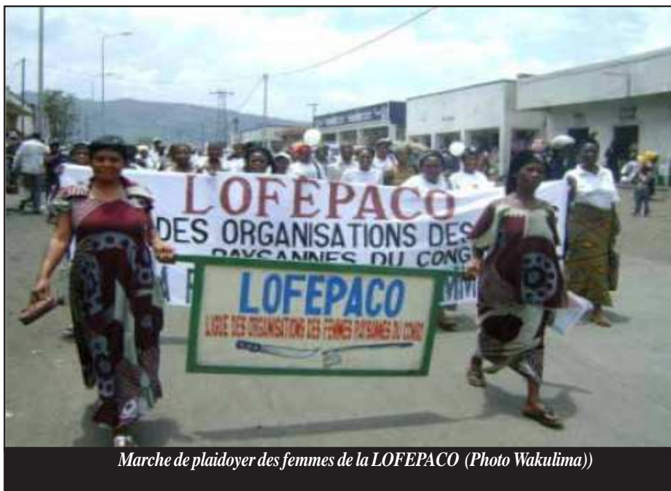
Marche de plaidoyer des femmes de la LOFEPACO

À la suite de cette réunion et d'autres activités connexes, les agricultrices sont plus habilitées à accéder aux terres agricoles. Les participants ont convenu d'informer et de sensibiliser la population et particulièrement les femmes paysannes sur la procédure d'acquisition de titres de propriété.