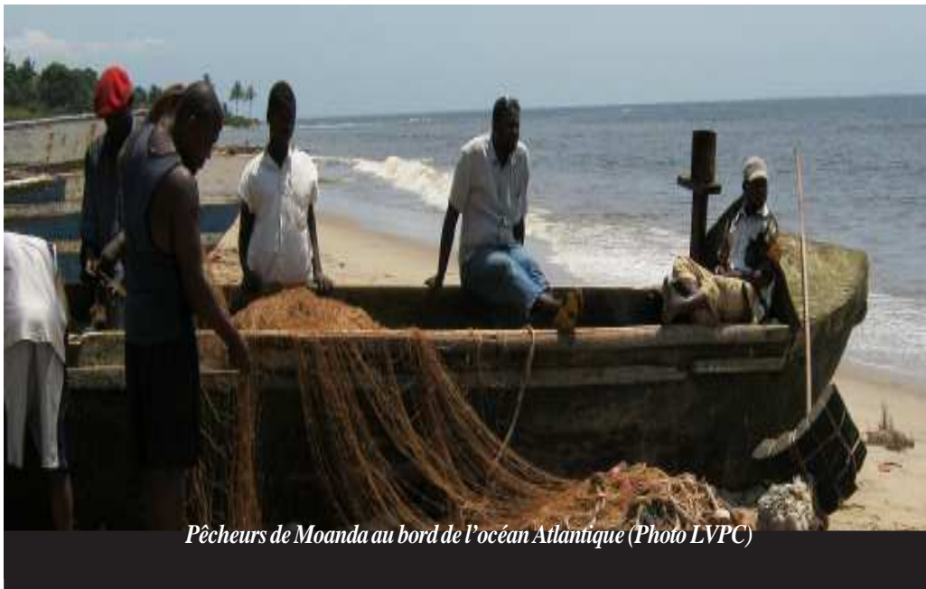
Pêcheurs de Moanda au bord de l'océan Atlantique

Pour Sylvain Tusanga, chef de division chargé de la planification au service national de promotion et développement de la pêche, le gouvernement congolais doit inciter les opérateurs à intervenir au niveau de la production au lieu de faire la commercialisation et créer aussi un cadre susceptible de promouvoir la pêche en RDC.