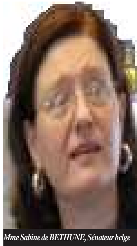
Mme Sabine de BETHUNE, Sénateur belge

l'évacuation et à la commercialisation, Enclavement des zones de productions (mauvais état des routes de desserte agricoles), insuffisance de moyen de transport (gros véhicules, pirogues) et emballages appropriés. Les difficultés liées à la terre telles que les conflits de terre (spoliation des sites), tracasseries administratives (taxes illicites) et lotissement anarchique des sites d'exploitations agricoles. Conflit coutumier. Les difficultés liées aux renforcements des capacités telles que l'insuffisance en formation techniques, analphabétisme et finalement l'accès à l'internet et à l'acquisition de matériel informatique. A qui s'adressent les paysans ? la réponse est simple, A ceux qui s'intéressent à l'agriculture et particulièrement : aux autorités politico-administratives de la RDC ainsi qu'aux responsables de la coopération bilatérale et multilatérale. Les organisations des paysans producteurs vous invitent à les rejoindre pour surmonter ensemble les obstacles pour renforcer les actions de développement agricole. D'où l'intitulé même du titre qui met l'accent sur le changement de l'agriculture en RDC.