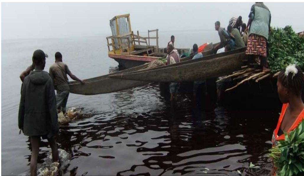
Les femmes ont été présentes à toutes les activités de pêche à Inongo