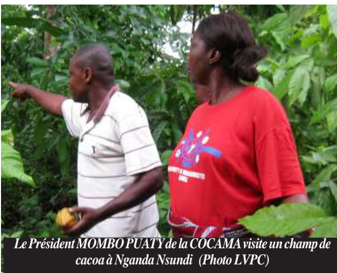
Le Président MOMBO PUATI de la COCAMA visite un champ de cacao à Nganda Nsundi

suivantes : Le calendrier imposé par l'autorité locale ; L'imposition des prix par des autorités locales sous l'influence des opérateurs économiques.