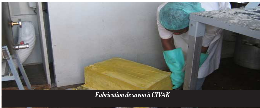
Fabrication de savon à CIVAK