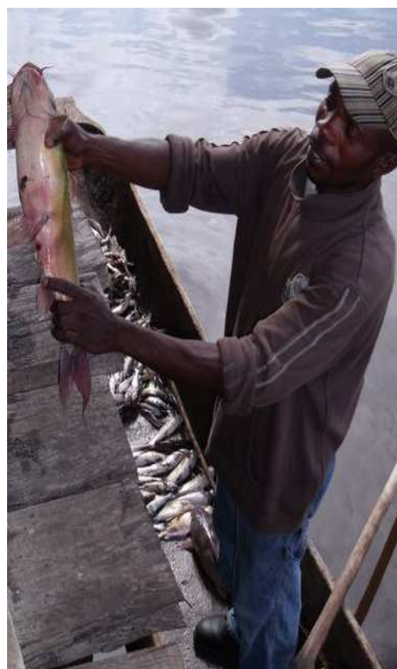
Un pêcheur de Moanda brandissant sa merveilleuse prise