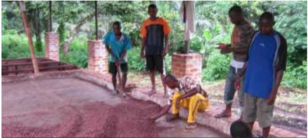
L'une de deux pistes réhabilitées du séchoir de la COCAMA à Nganda Nsundi

Les acteurs de cette filière sont les opérateurs économiques et les producteurs de cacao. Les producteurs recourent à un personnel pour ceux qui ont des quantités abondantes. Les opérateurs économiques utilisent les intermédiaires.