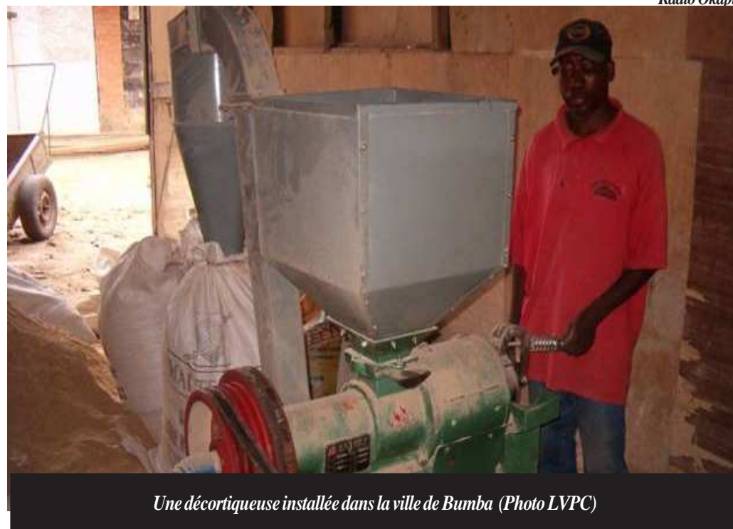
Une décortiqueuse installée dans la ville de Bumba