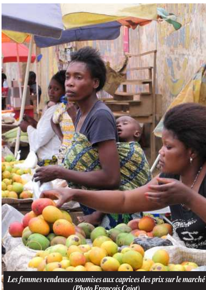
Les femmes vendeuses soumises aux caprices des prix sur le marché

En fait, 3.600 ménages d'agriculteurs ont reçu du projet 183.000 outils agricoles, 714 tonnes de semences vivrières, 2,3 tonnes de semences maraîchères et 311 unités de transformation comprenant des moulins, des décortiqueuses à riz, des râpeuses trancheuses et presses manioc ainsi que des malaxeurs de noix de palme. En plus des outils aratoires, semences et machines agricoles, 279 kits de matériaux