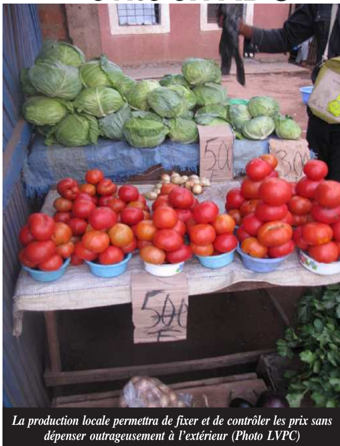
La production locale permettra de fixer et de contrôler les prix sans dépenser outrageusement à l'étranger

La sécurité alimentaire n'est assurée que dans 7 territoires (dont 5 au Bas-Congo et 2 au Sud-Kivu) sur les 146 que compte le pays, a-t-il démontré. Un autre tableau a montré l'extraversion de la consommation congolaise avec 150 mille tonnes de surgelés et 80 mille tonnes de poulets congelés importés. Le pire est l'importation de 400 mille tonnes de riz et de 60 mille tonnes d'huile de palme que l'on peut produire sur